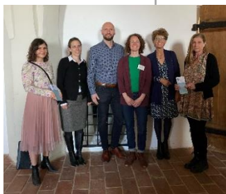
Teilnehmende aus der Region: Welt-Brücke Eichstätt e.V., AK Shalom, vhs Ingolstadt mit Eine Welt-Regionalpromotorin Obb. Nord.

Kommunen: (je 500 Euro): Augsburg & Mömlingen