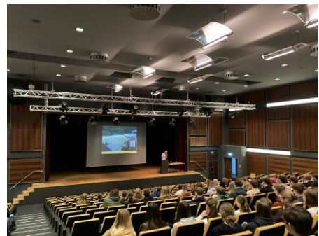
Frank Herrmann: Kleinbäuerinnen und Kleinbauern ernähren die Welt